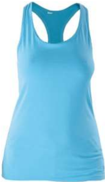
DEBARDEUR DOS NAGEUR