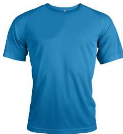
TEE SHIRT HOMME