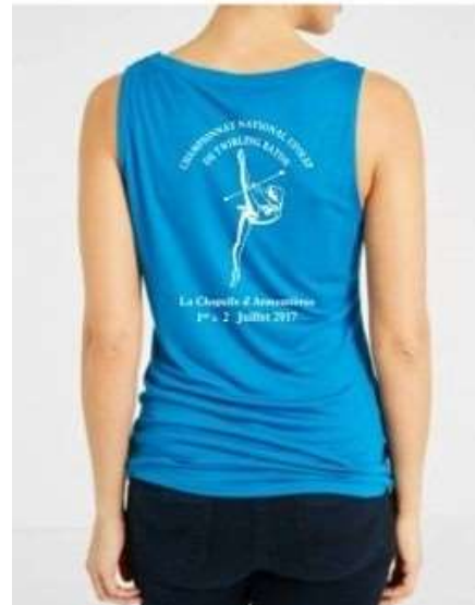
VISUEL MARQUAGE DOS