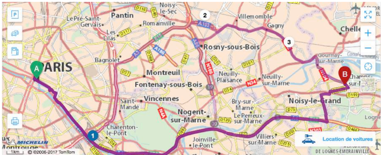
Base de Loisirs, 1 promenade des Pâtis 77420 Champs-sur-Marne

Depuis Paris prendre l'autoroute de l'Est A4 direction Metz et sortir à la sortie 10 en direction Noisy-le-Grand, traverser la ville et prendre direction Marnes-la-Vallée-cité N 370 puis D 370 sortie Noisy-le-Grand D 75 et là pas de soucis, ce sera bien fléché !