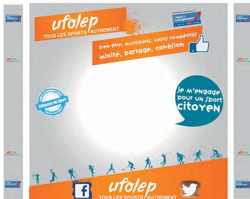
Photocall Sport Citoyen