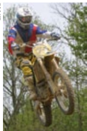
Pas de motocross sans protections adaptées.