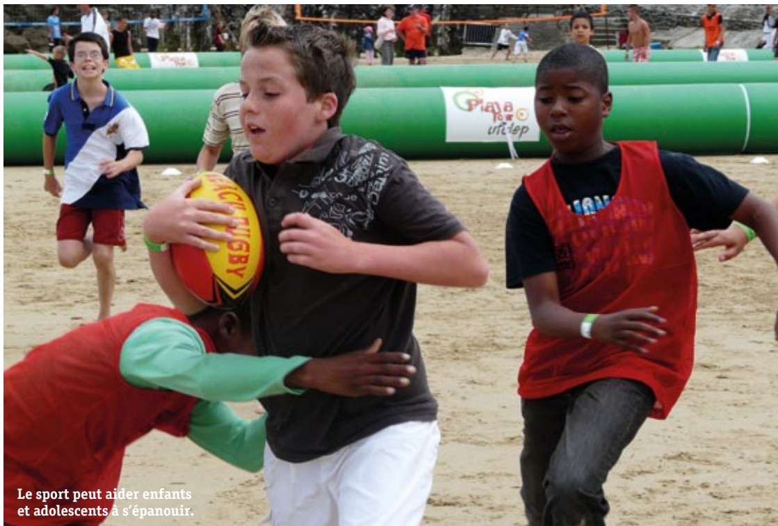
Le sport peut aider enfants et adolescents à s'épanouir.